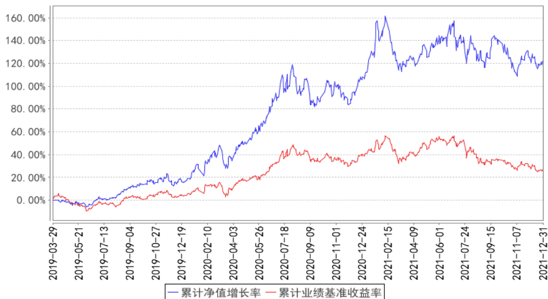
华宝大健康混合累计净值增长率与同期业绩比较基准收益率的历史走势对比图

注：按照基金合同的约定，基金管理人应当自基金合同生效之日起 6 个月内使基金的投资组合比例符合基金合同的有关约定，截至 2019 年 09 月 29 日，本基金已达到合同规定的资产配置比例。