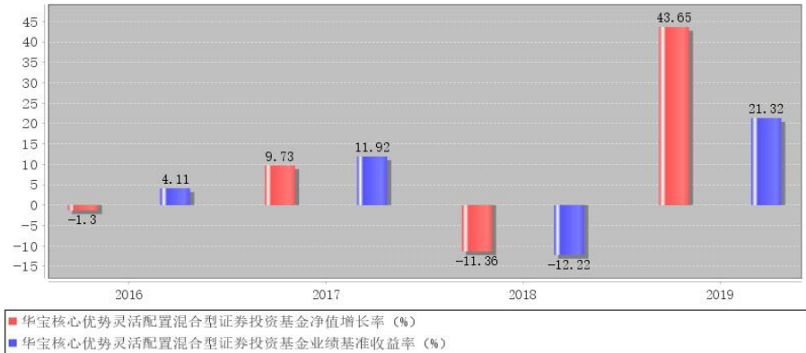
华宝核心优势灵活配置混合型证券投资基金每年净值增长率与同期业绩比较基准收益率的对比图