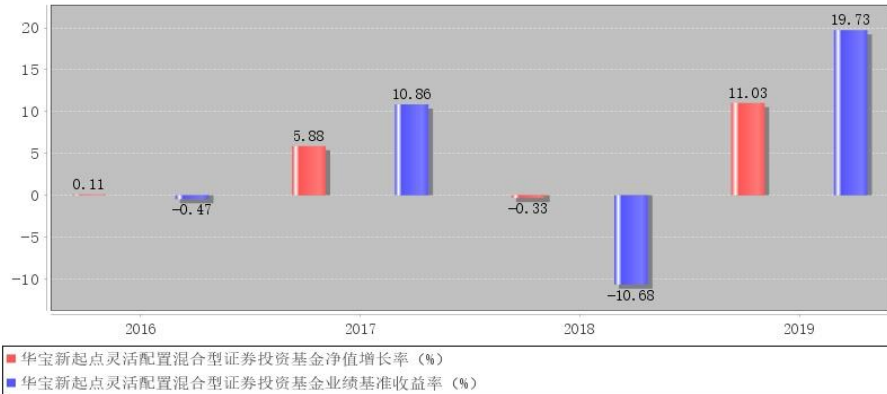
华宝新起点灵活配置混合型证券投资基金每年净值增长率与同期业绩比较基准收益率的对比图