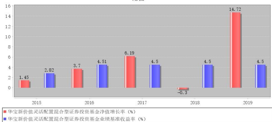
华宝新价值灵活配置混合型证券投资基金每年净值增长率与同期业绩比较基准收益率的对比图