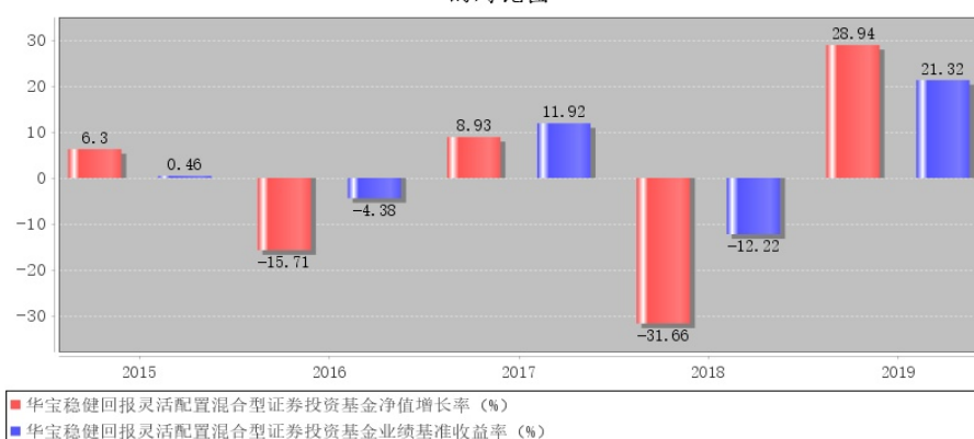
华宝稳健回报灵活配置混合型证券投资基金每年净值增长率与同期业绩比较基准收益率的对比图