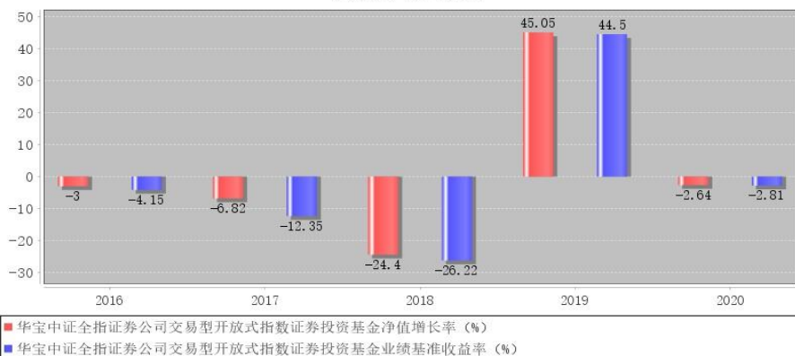
华宝中证全指证券公司交易型开放式指数证券投资基金每年净值增长率与同期业绩比较基准收益率的对比图