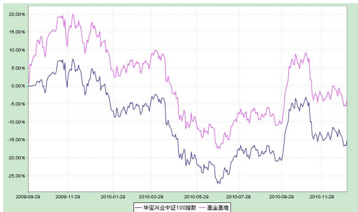
华宝兴业中证 100 指数证券投资基金 份额累计净值增长率与业绩比较基准收益率历史走势对比图 （2009 年 9 月 29 日至 2010 年 12 月 31 日）

注：基金依法应自成立日期起 6 个月内达到基金合同约定的资产组合，截至 2009 年 11 月 6 日，本基金已完成建仓且达到合同规定的资产配置比例。