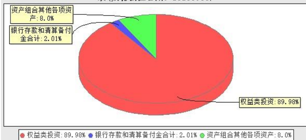
华宝中证细分化工产业主题交易型开放式指数证券投资基金投资组合资产配置图表(数据截止日期: 20230930)