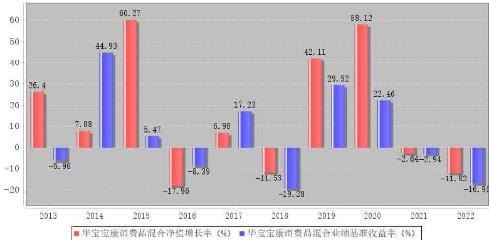
华宝宝康消费品混合每年净值增长率与同期业绩比较基准收益率的对比图