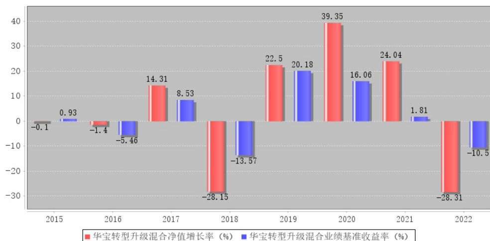
华宝转型升级混合每年净值增长率与同期业绩比较基准收益率的对比图