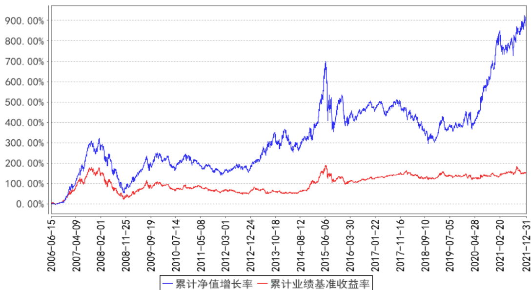
华宝收益增长混合累计净值增长率与同期业绩比较基准收益率的历史走势对比图

注：按照基金合同的约定，基金管理人应当自基金合同生效之日起 6 个月内使基金的投资组合比例符合基金合同的有关约定，截至 2006 年 12 月 15 日，本基金已达到合同规定的资产配置比例。