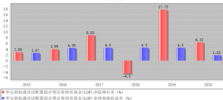
华宝新机遇灵活配置混合型证券投资基金 (LOF) 每年净值增长率与同期业绩比较基准收益率的对比图