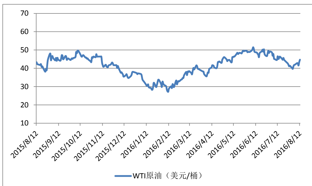
WTI 原油价格走势回顾图