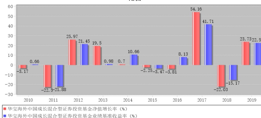
华宝海外中国成长混合型证券投资基金每年净值增长率与同期业绩比较基准收益率的对比图