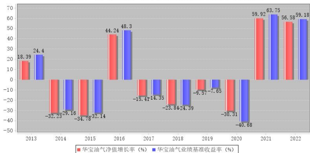
华宝油气每年净值增长率与同期业绩比较基准收益率的对比图